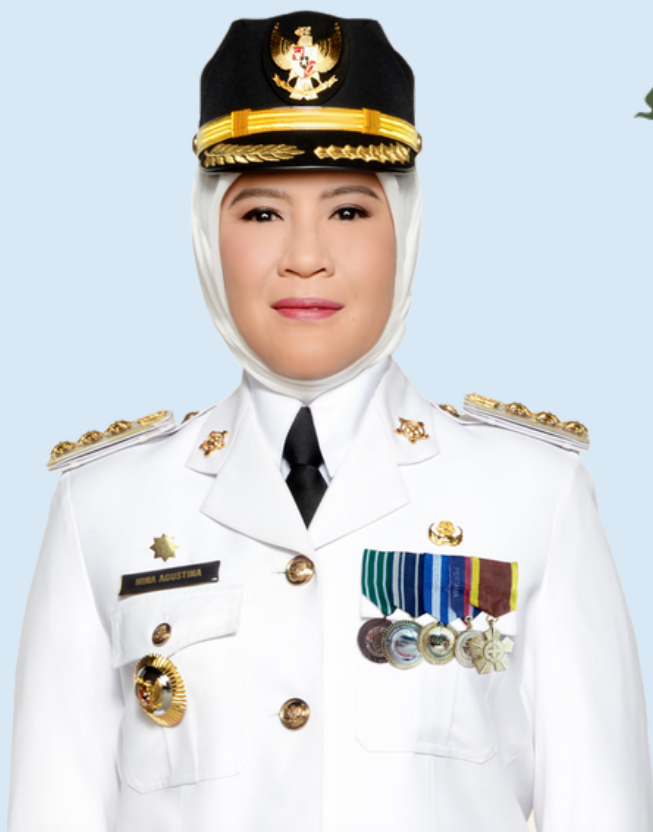
Hj. NINA AGUSTINA Bupati Indramayu

Indeks Kualitas Air merupakan suatu nilai yang menggambarkan kondisi kualitas air yang merupakan nilai komposit parameter kualitas air dalam suatu wilayah pada waktu tertentu.