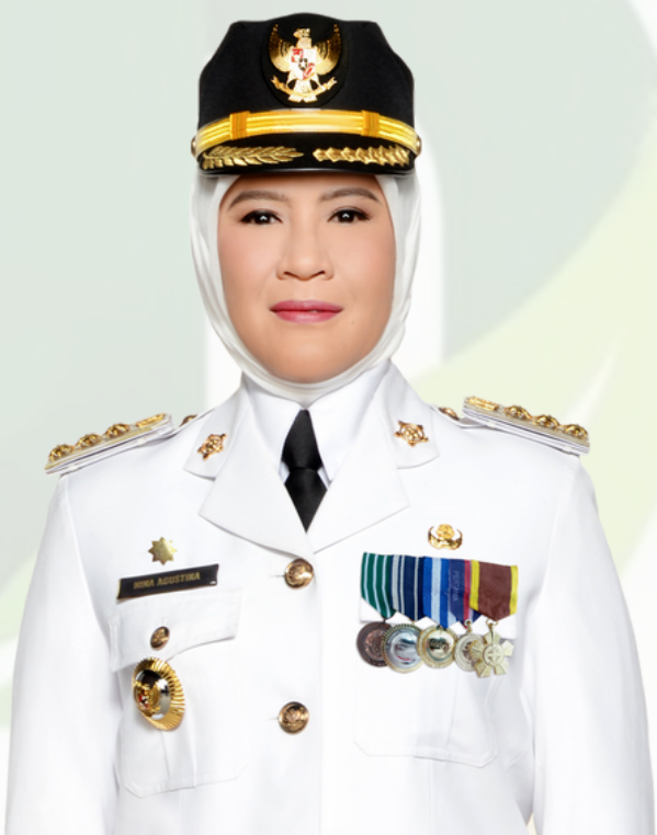
Hj. NINA AGUSTINA Bupati Indramayu