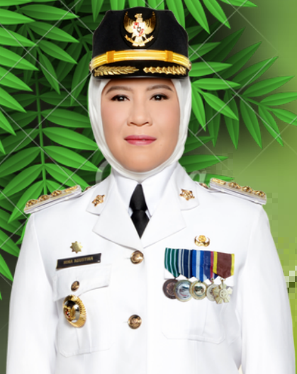
Hj. NINA AGUSTINA Bupati Indramayu